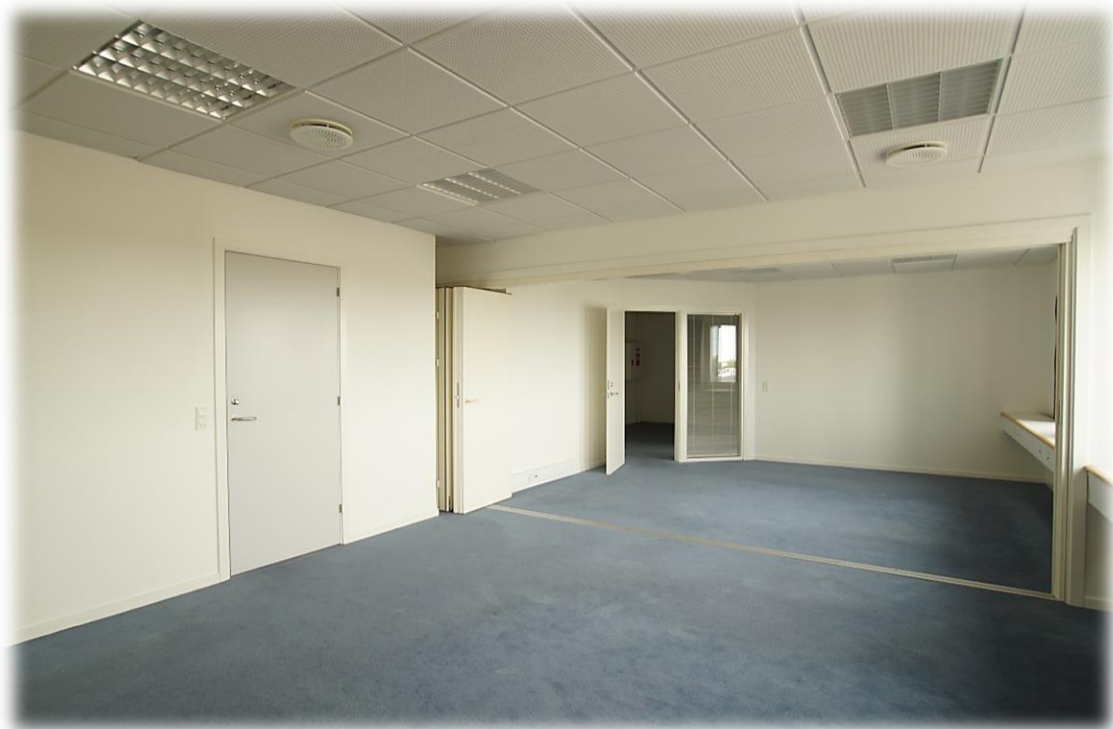
Foldevæg med mulighed for opdeling