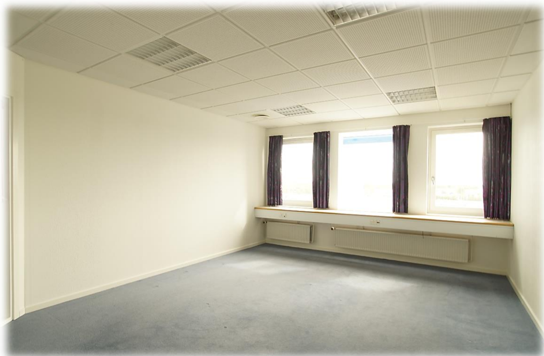
Lyse og venlige lokaler