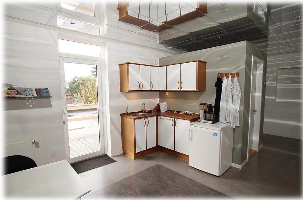
Spændende lofter.(fælles arealet)