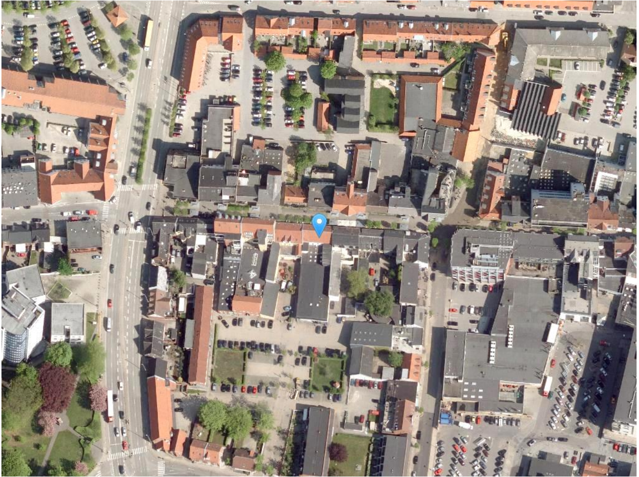
Bredgade 55, 7400 Herring