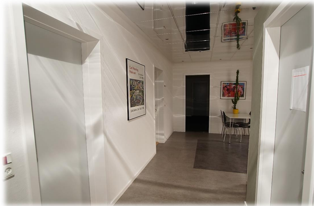
Velkommen på 1. Sal (Fællesareal)