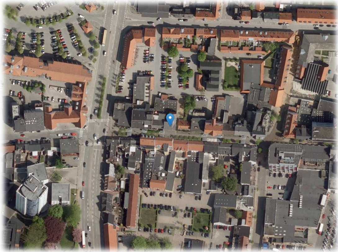
Bredgade 50, 7400 Herring