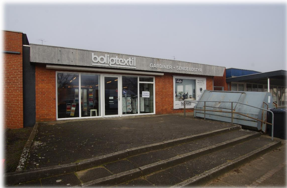
Butikken set fra syd og parkeringspladsen.